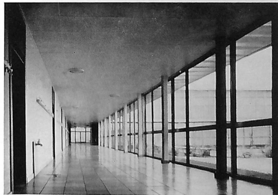
Korridor i sydflojen.

For hver af de to karakterrækker, årskarakterer og eksamens-karakterer (herunder de som eksamens-karakterer overførte årskarakter) udregnes et gennemsnit af de givne karakterer. Resultatet udtrykkes med en decimal. Af de to gennemsnit udregnes eksamensresultatet, der udtrykkes med en decimal.